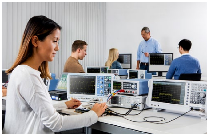
Адаптированы для использования в образовательных учреждениях, лабораториях и системах на базе стоек.

Что бы ни случилось в ситуации, когда неквалифицированные учащиеся получают свой первый опыт в практической работе с электроникой, все выходы источников питания серии R&S®NGE100 имеют защиту от короткого замыкания и поэтому не подвержены такого рода повреждениям.