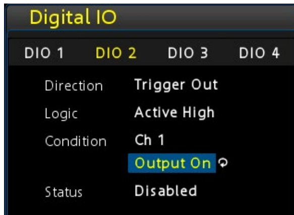
Здесь, канал 1 опционального цифрового интерфейса ввода/вывода используется в качестве входа запуска.

других опций, аппаратно опция R&S®NGE-K103 уже установлена, ее функции активируются с помощью ключевого кода.